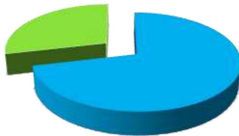
Stan posiadania akcji na dzień sporządzenia raportu za III kwartał 2018 rok: