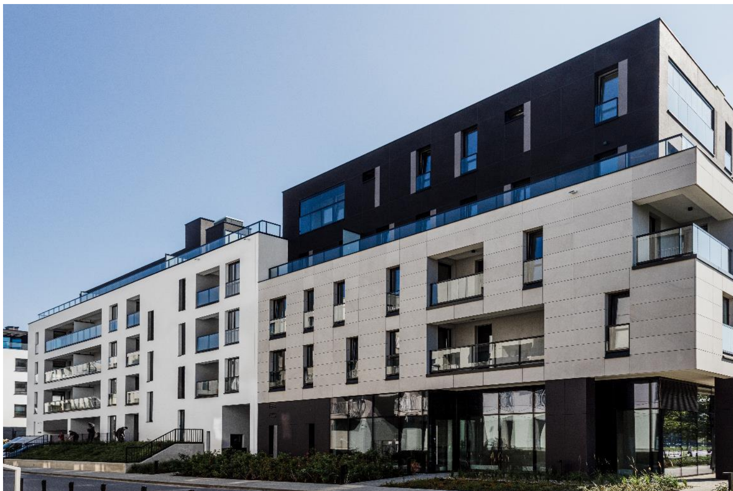
Acciona Wilanów B6

Zobowiązania długoterminowe w III kwartale 2021 r. uległy zmniejszeniu się o 10.464 tys. zł w porównaniu do stanu z 30.06.2021 r.