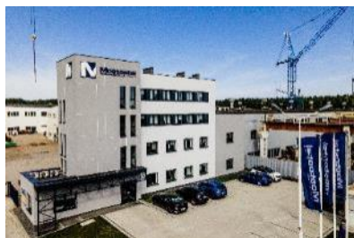
Siedziba Mostostal Kielce S.A.