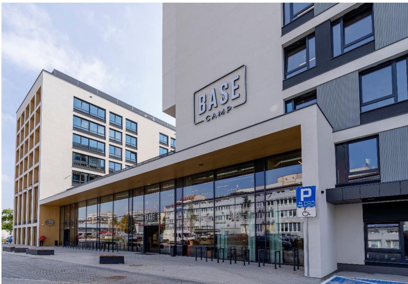
Dom studencki BaseCamp Katowice

W ocenie Zarządu nie występują inne informacje istotne dla oceny sytuacji Spółki, niż wymienione w notach do skróconego jednostkowego sprawozdania finansowego za okres 01.07.2021 roku – 30.09.2021 roku oraz pozostałych punktach do pozostałych informacji do skróconego jednostkowego sprawozdania finansowego za okres 01.07.2021 roku – 30.09.2021 roku.