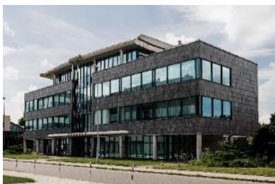
Siedziba AMK Kraków S.A.