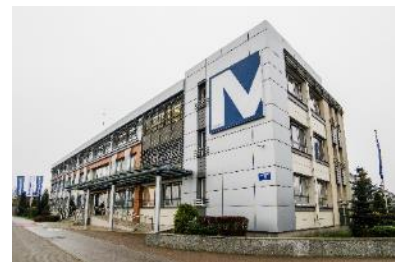
Siedziba Mostostal Płock S.A.

Mostostal Warszawa S.A. wchodzi w skład grupy kapitałowej Acciona S.A. z siedzibą w Madrycie. Acciona Construcción S.A. jest właścicielem 62,13 % akcji Mostostalu Warszawa S.A. wg stanu na 30.09.2021 r.