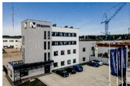
Siedziba Mostostal Kielce S.A.