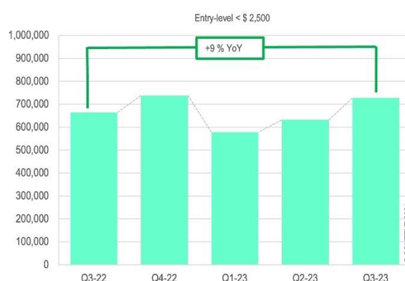
Wykres 1 – globalne dostawy drukarek 3D według klas cenowych

CONTEXT przewiduje, że po trudnym roku 2023 rynek druku 3D przyspieszy w nadchodzących latach. Producenci będą w coraz większym stopniu wykorzystywać możliwości druku 3D do wytwarzania spersonalizowanych produktów na dużą skalę, uwzględniając indywidualne preferencje klientów. Oczekuje się, że ten trend zrewolucjonizuje branżę, oferując przedsiębiorstwom przewagę konkurencyjną w dostarczaniu rozwiązań „szytych na miarę” 2 .