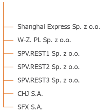
Tab. Struktura Grupy Kapitałowej.