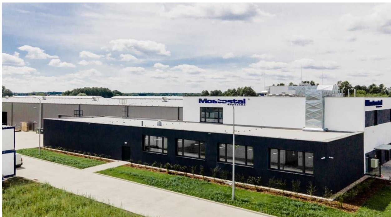
Baza Sprzętowo Transportowa firmy Mostostalu Warszawa w Urzucie

Wartość zobowiązań krótkoterminowych z tytułu dostaw i usług na 31.03.2023 roku wyniosła 189.289 tys. zł. i w porównaniu do 31.12.2022 roku była niższa o 13.375 tys. zł.