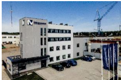
Siedziba Mostostal Kielce S.A