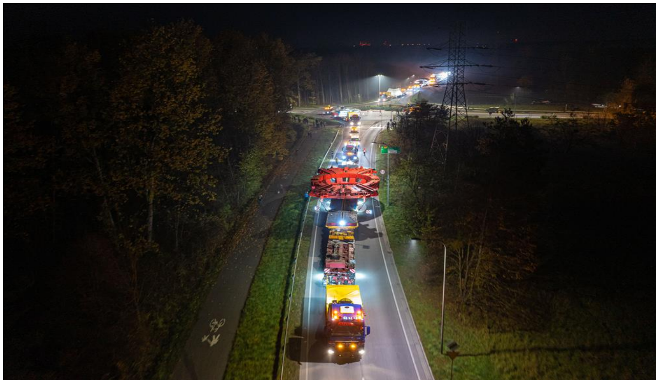
Nocny transport TBM przez Polskę

Suma przychodów netto ze sprzedaży spółek objętych konsolidacją metodą pełną wyniosła za I kwartał 2023 roku 325.537 tys. zł. Obroty wewnątrz Grupy Kapitałowej stanowiły kwotę 8.574 tys. zł., tj. 2,6 % przychodów netto ze sprzedaży ogółem bez wyłączeń konsolidacyjnych.