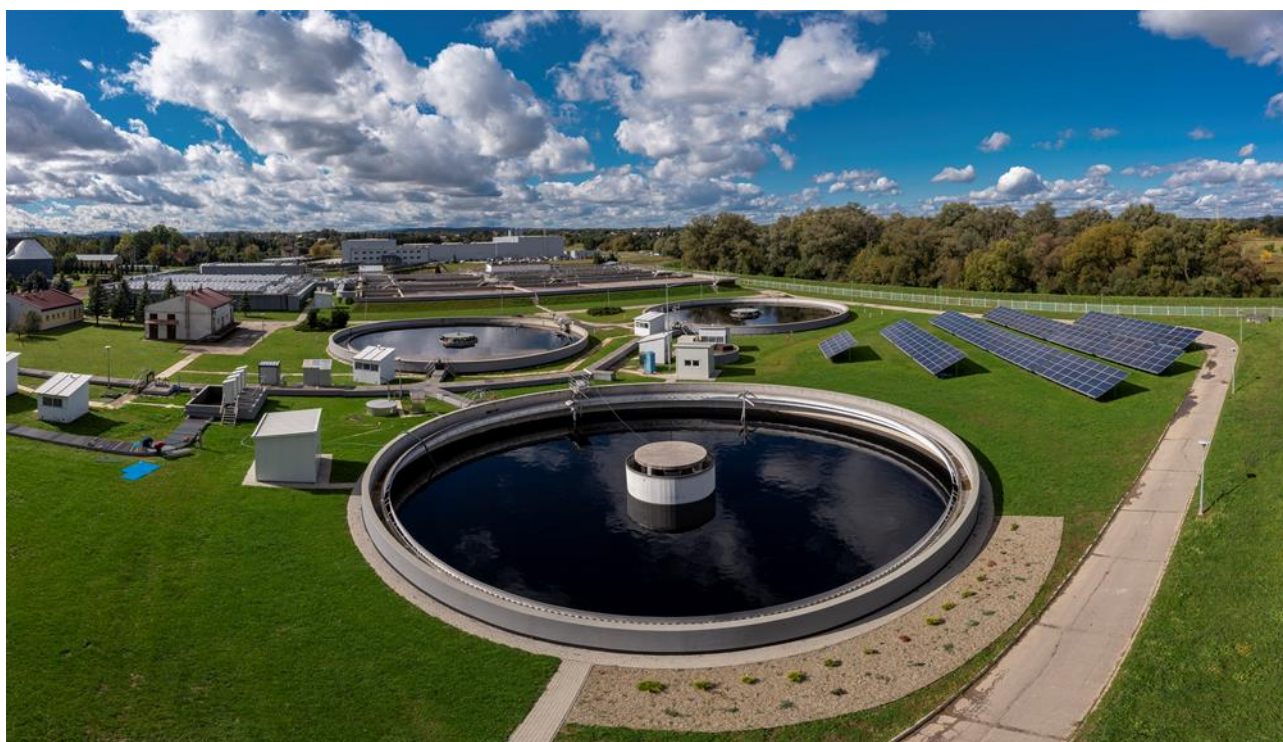
Rozbudowa i przebudowa oczyszczalni ścieków w Krośnie

23.12.2013 roku Mostostal Warszawa S.A. i Acciona Construcción S.A. zawarły aneksy do 3 umów pożyczek na łączną kwotę 48.409 tys. EUR (równowartość w PLN 201.815 tys. zł), w których ustalono warunki spłaty tych pożyczek na takie, że termin spłaty pożyczek wydłużono na czas nieokreślony i Mostostal Warszawa S.A. będzie decydował o ich spłacie. Zgodnie z MSR 32 Mostostal Warszawa zaprezentował te pożyczki w kapitałach własnych.