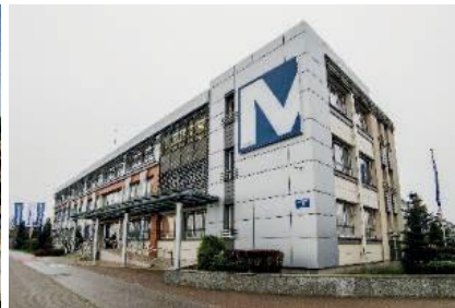
Siedziba Mostostal Płock S.A.