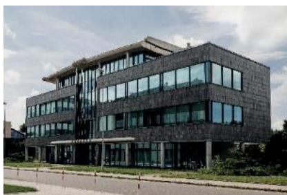
Siedziba AMK Kraków S.A

W I kwartale 2023 roku w skład Grupy Kapitałowej Mostostal Warszawa objętej konsolidacją wchodziły następujące spółki: Spółka Dominująca: Mostostal Warszawa S.A. Spółki zależne: Mostostal Kielce S.A., AMK Kraków S.A., Mostostal Płock S.A., Mostostal Power Development Sp. z o.o. Mostostal Warszawa S.A. wchodzi w skład grupy kapitałowej Acciona S.A. z siedzibą w Madrycie. Acciona Construcción S.A. jest właścicielem 62,13 % akcji Mostostalu Warszawa S.A. wg stanu na 31.03.2023 rok.