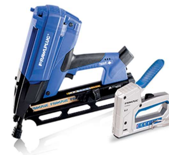
Techniki montażu ręcznego i bezpośredniego