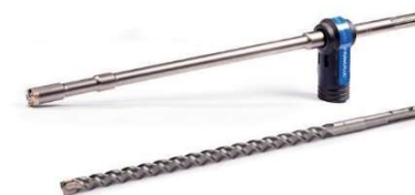
Akcesoria do elektronarzędzi